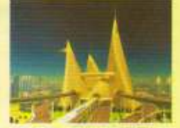
The Biggest Investment Region