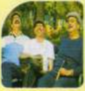
Senior Citizen Park