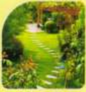
Land Scape Garden