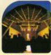
Open Air Theater