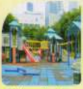
Children Play Area