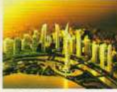
Central Business District